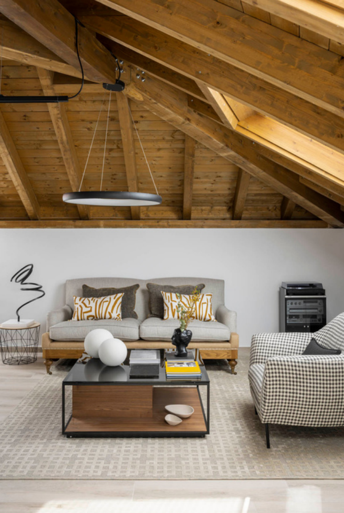
Sofá de 2 plazas de Crearte con tela de lino gris Venezuela. Cojines Bucle color carbón, de Flamenco . Cojines estampados, de Pepe Peñalver . Mesa auxiliar, de Maison du Monde co escultura de Maite Carranza . Alfombra, de Gancedo . Sillón, de Casual con tela de Güell Lamadrid . Mesa de centro, de Kendo con esculturas redondas blancas de Arbe , jarrón cabeza negra de Sakura Atelier , y libros y recipientes blancos de Zara Home .