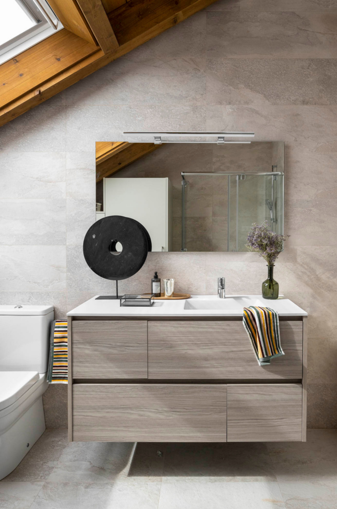
Escultura, de Arbe. Jarrón y toallas, de Zara Home. Arreglo floral de Sakura Atelier.